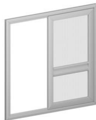
Slika 4. Klizni komarnik