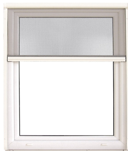
Slika 3. Rolo komarnik